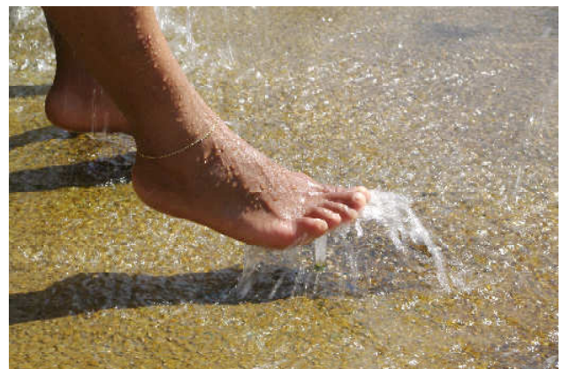
Espace de jets de massages