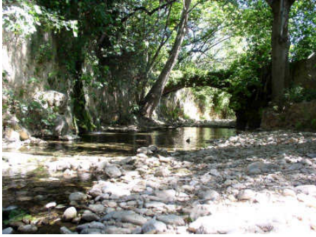
AQUEDUC DE LA SOURCE DE LA BAUME

Aménagement de l'extension du jardin (Ville de Toulon)