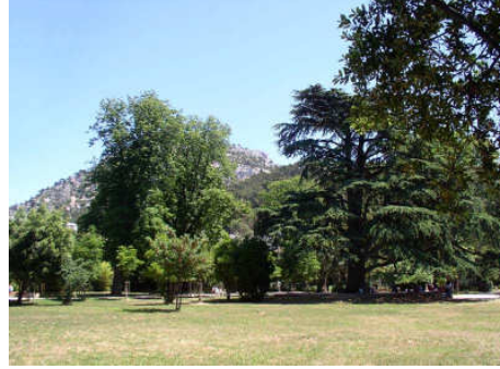
JARDIN DU LAS ANCIEN JARDIN D'ACCLIMATATION

Suite à l'acquisition par le Conseil Général du Var de la partie Nord du parc, une extension fut envisagée avec comme projet d'ouvrir le jardin sur la rivière et de valoriser la source de la Baume dont l'eau arrive en bordure du parc via un aqueduc. Cette eau parcourt maintenant le jardin et lui apporte une dimension nouvelle